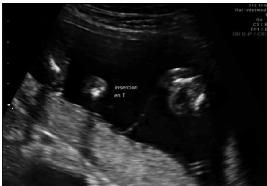
Figura 2. Marcador ecográfico de gestación monocorial en primer trimestre de embarazo: signo T.

tico de restricción de crecimiento fetal (12,13) . [Evidencia 4]