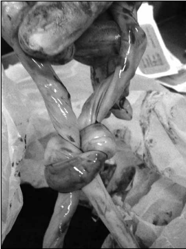
Figura 4. Nudo verdadero entre cordones de gestación monocorial monoamniótica.

estructurales y riesgo de prematuridad más que en la presencia de patología funicular (35) .