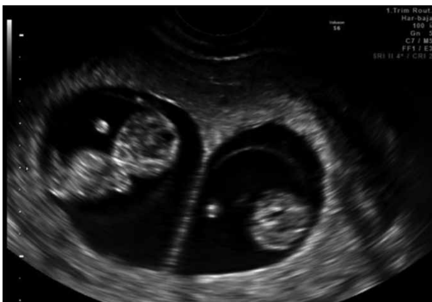
Figura 1. Marcador ecográfico de gestación bicorial en primer trimestre de embarazo: signo lambda.

Se debe asignar la edad gestacional según feto de mayor LCN para evitar error posterior en diagnós-